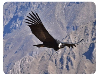
TIP DE VIAJE | VALLE DEL COLCA

Cada espacio entre las ciudades, montañas, valles, hasta iglesias mantienen muy activo al visitante que desea recorrer estas dos ciudades de Perú. Este recorrido es sin duda ideal, para aquellos que buscan aprovechar cada día de viaje en dos pintorescos espacios del país.