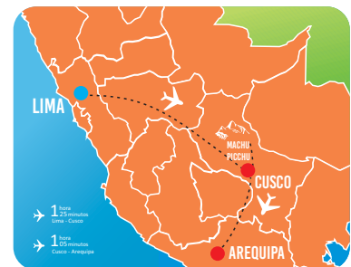
ROTA DE VIAJE