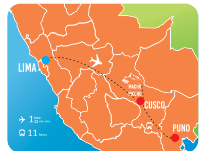
② RUTA DE VIAJE