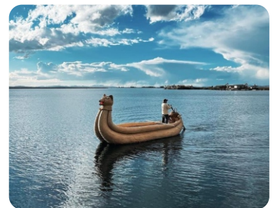
★ TIP DE VIAJE | UROS

De seguro no será fácil olvidar el conocer, no sólo los espacios arquitectónicos del imperio de los Incas, sino también los secretos mejores guardados de los antiguos peruanos, lagunas encantadoras entre los Andes del Perú y el contacto con cada elemento de la naturaleza.